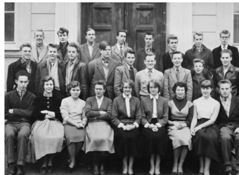
KLASS RI+AI 1954-55