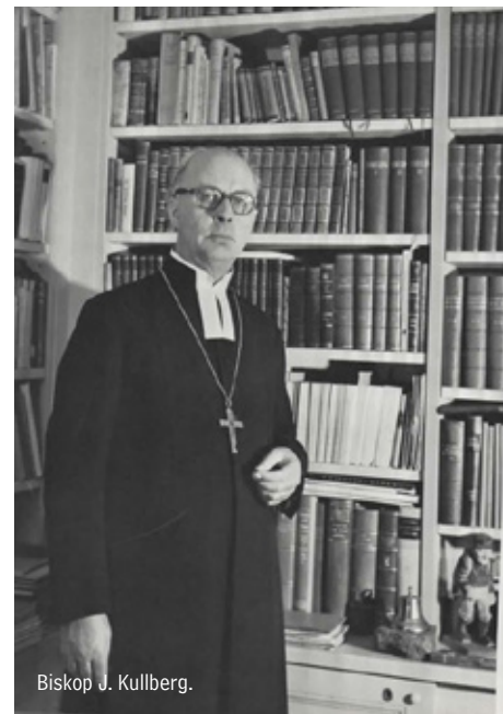
Biskop J. Cullberg.

Läroverket hade arbetat efter former från