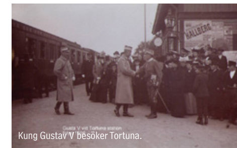
Gustav V vid Tortuna station. Kung Gustav V besöker Tortuna.