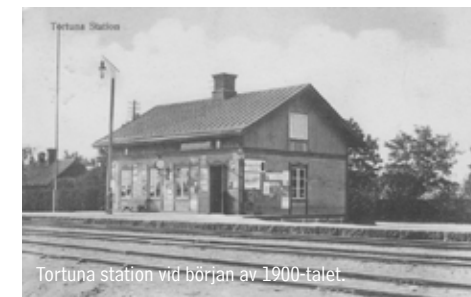
Tortuna station vid början av 1900-talet.