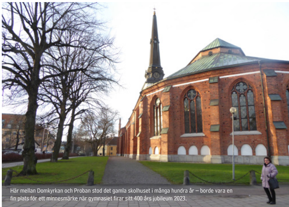
Här mellan Domkyrkan och Proban stod det gamla skolhuset i många hundra år – borde vara en fin plats för ett minnesmärke när gymnasiet firar sitt 400 års jubileum 2023.