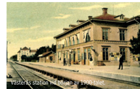
Västerås station vid början av 1900-talet.