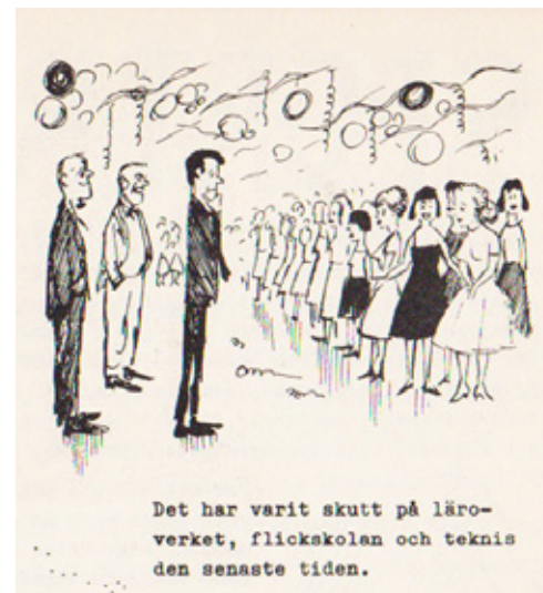
Det har varit skutt på läroverket, flickskolan och tekniska den senaste tiden.

Första låtarna ekade alltid över ett folktomt golv. Cocacola-drickande i "baren" och ideliga